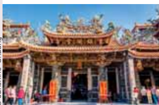
Temple Jenn Lann à Dajia.

Maison des cultures du monde, 2 rue des Bénédictins (du mardi au dimanche de 14h à 18h) et Centre culturel J. Duhamel, 2 rue de Strasbourg (du mardi au vendredi de 13h à 18h, samedi, de 10h à 12h30 et les soirs de spectacle). Entrée libre. Contact : 02 99 75 82 90.